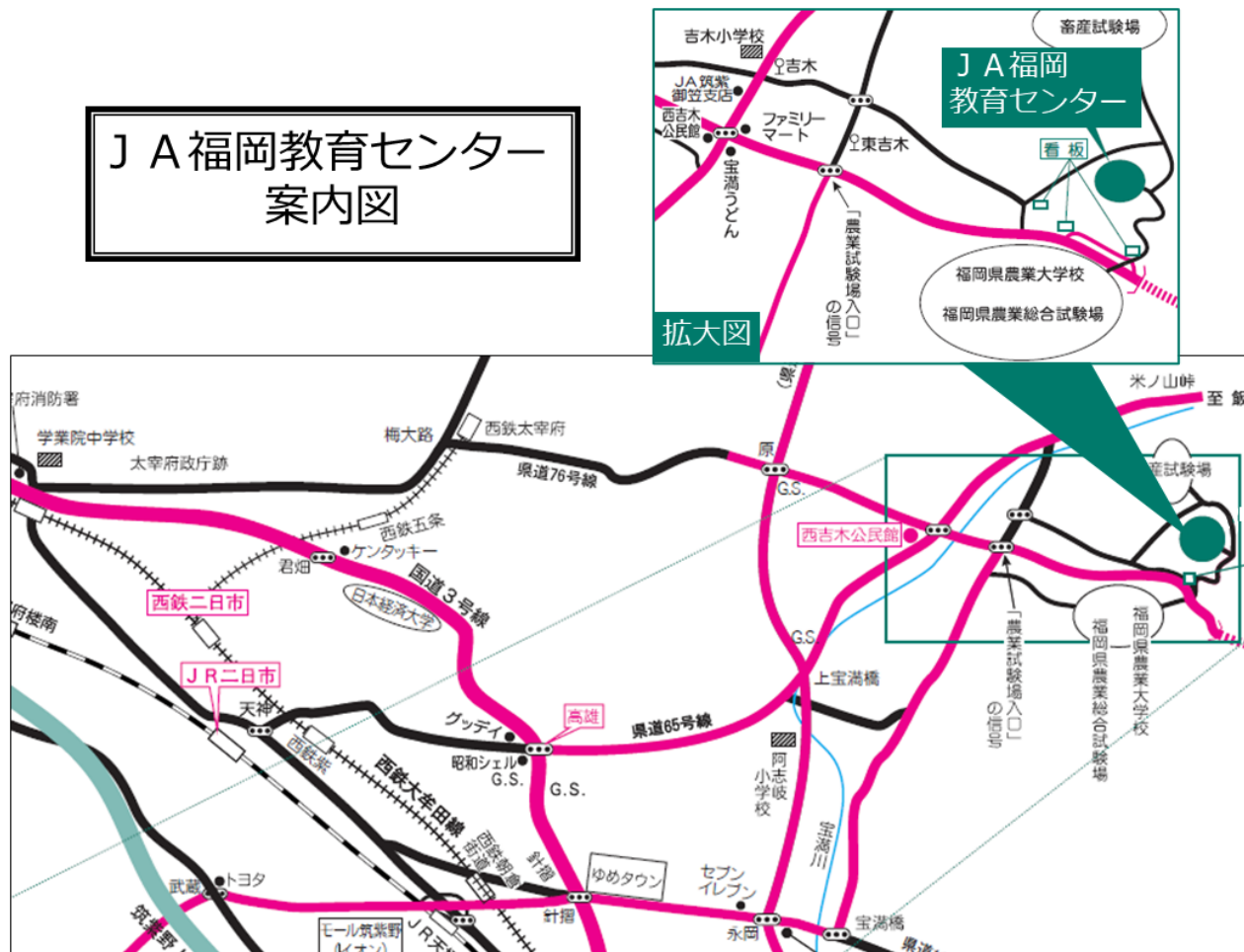
J A 福岡教育センター 案内図

会場施設には宿泊施設や食堂がありますが、利用の可否については現状未定となっております。会場施設との調整によって、利用可能の場合には通知いたします。